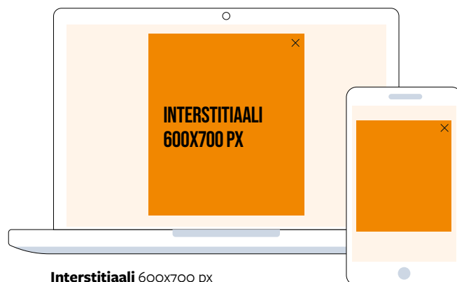
Interstitiaali 600x700 px